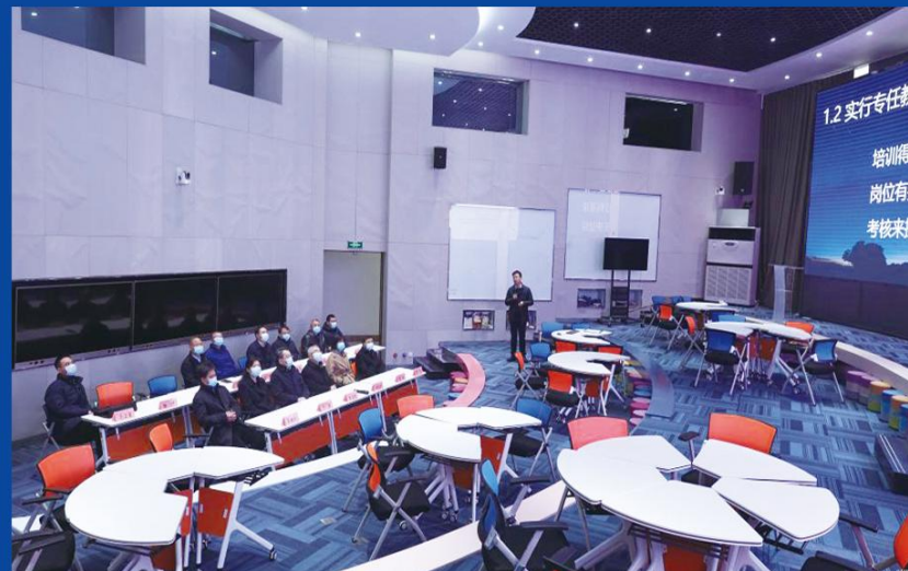
新维教师发展空间站