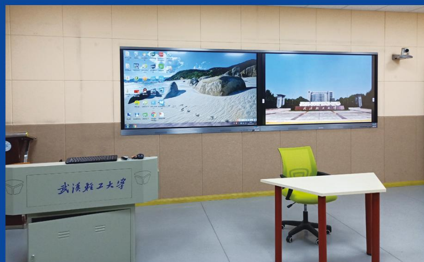
微格教学演练培训室