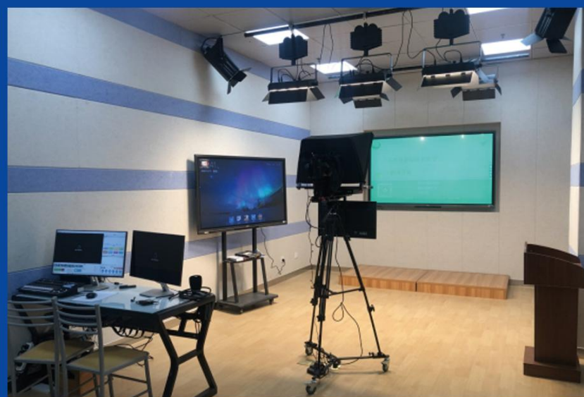
微课视频拍摄工作室